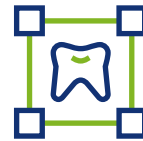
Outils de traitement d'image personnalisables